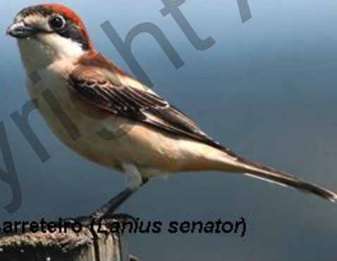
Picanço - Barreteiro ( Lanius senator )