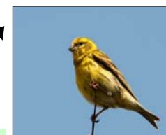
Milheirinha ( Serinus serinus )