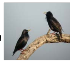
Estorninho- Preto ( Sturnus unicolor )

0.054551 0.028139 0.019090 0.017476 0.013715 0.010592 0.008295 0.007653 0.006963 0.003587 0.002091