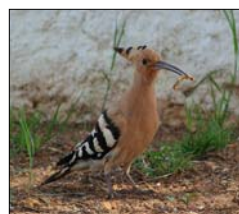
Poupa ( Upupa epops )

Índice de diversidade calculado através da combinação de medidas parcelares indicativas do nº de espécies (riqueza), abundância (Shannon-Wiener) e importância específica (Valorização).