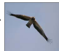
Águia-Calçada ( Hieraetus pennatus )