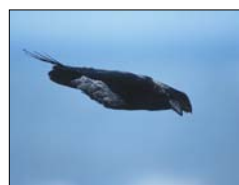
Corvo-comum ( Corvus corax )